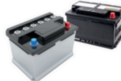
Tractie- en autobatterijen