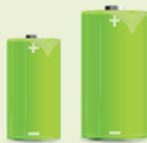
C- en D-batterijen